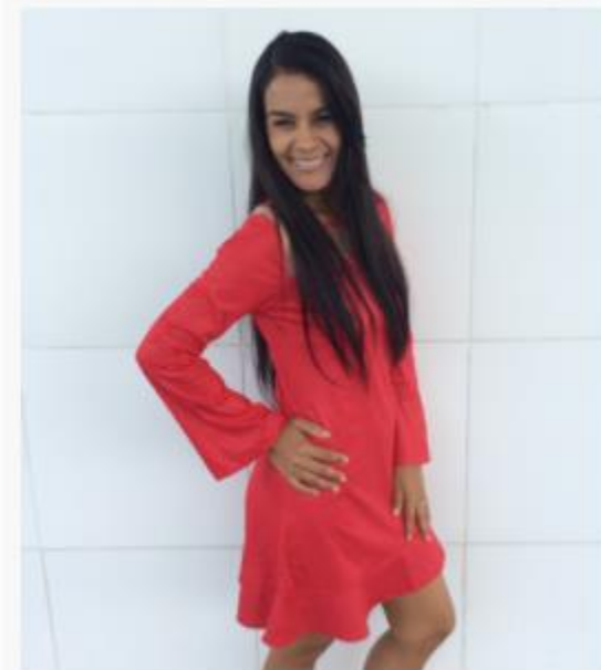
Ada Rebeca Língua Portuguesa